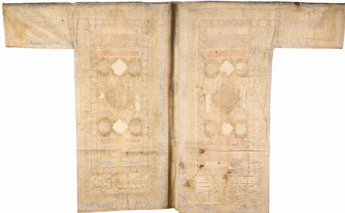
شکل ۱. جامه فتح شاه عباس بزرگ.