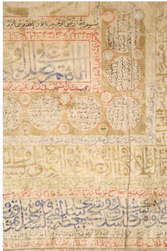
شکل ۳. بخشی از سوره‌های به کاررفته بر حواشی جامه فتح.

در تمام علوم خفیه بکار گرفته شده؛ موضوع جادو و سحر وجود داشت که ریشه اعتقادی در تاریخ گذشته داشته و بگفته محققین؛ برگرفته از بازتاب اندیشه انسان‌هایی است که سعی داشتند بر حوادث پیرامون خود و اتفاقات پیش آمده تسلط یابند. همچنین لفظ جادو در تاریخ باستان استفاده می‌شد و بعدها با رشد اندیشه‌های اعتقادی معانی دیگری یافت. جادو در واقع «از واژه هندو اروپایی مگ mag به معنای مجموعه باورها و اعمالی است که در جهت تاثیرگذاری بر نیروهای ماورای طبیعه و کنترل و دست کاری آنها پدید آمده بود و بر پایه شکلی خاص از جهان، زندگی و ارتباط با موجودات با یکدیگر بنا شده و شامل اعمالی است از نظر روش بسیار انتظام یافته و با نمادگذاری و ارتباط مفروض نیروهای جهان تمهید شده‌اند» (ساروخانی ۱۳۸۰: ۲۴۸). درباره قدرت جادو در برخی تفکرات ادیان سخن به میان آمده است. مانند: فرهنگ نامه مزدیسنا که در این باره می‌نویسد: «چیزی یا کاری که در آن فریبندگی و گیرندگی باشد. کاری که آدمی به