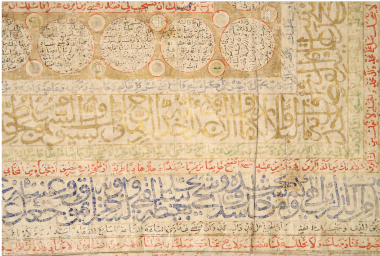
شکل ۴. حواشی دایره - مستطیلی با رنگ‌های طلایی آبی سبز قرمز با سوره‌های قرآن کریم (جامه فتح شاه عباس بزرگ)

را از دو طریق به دست آورد. ابتدا بررسی محتوایی سوره‌ها و تفسیر آنهاست که مفهوم متعالی ریشه‌های آیات و کلمات الهی را مشخص می‌کند. این ماهیت قدسی موجب شد تا به محتوا و مفهوم عدد، حرف و کلمه در باورهای ذوقی و عرفانی اسلامی صورت ماورایی بخشیده و برای آن نوعی تفکر مذهبی و اعتقادی قائل شوند. در این بخش برای دستیابی به دلایل رموز ماورایی جامه فتح؛ ریشه کلام یا کلمه، حرف، عدد از نظر اندیشه اسلامی بررسی و رمزگشایی می‌شود.