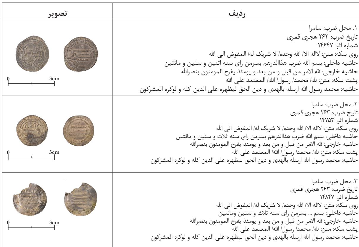
جدول ۴. سکه‌های معتمد همراه با نام مفوض.

از منظر نشانه‌شناسی سیاسی، لقب «المفوض» در واقع کوششی برای مشروع‌بخشی نمادین به جعفر بود؛ اما در عمل، این اقدام تأثیر چندانی در تحکیم موقعیت او نداشت. اگر چه سکه‌های ضرب سامرا در انتقال این پیام نمادین وفادار