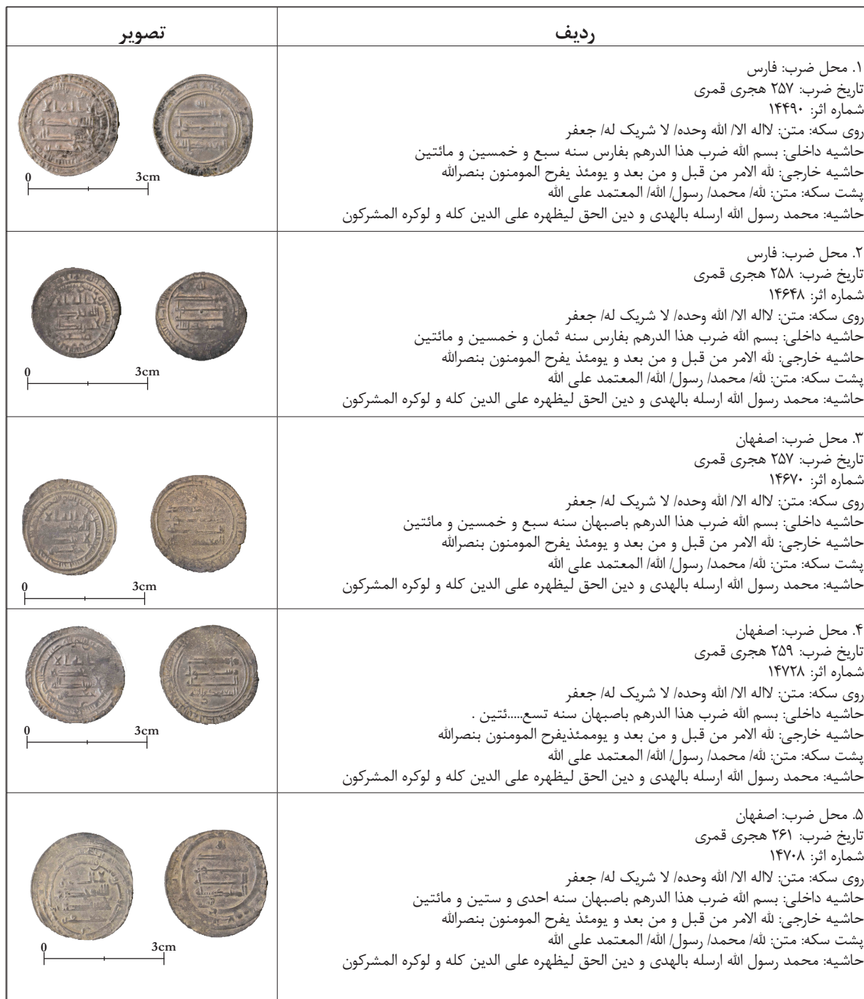
جدول ۱. سکه‌های معتمد همراه با نام جعفر.