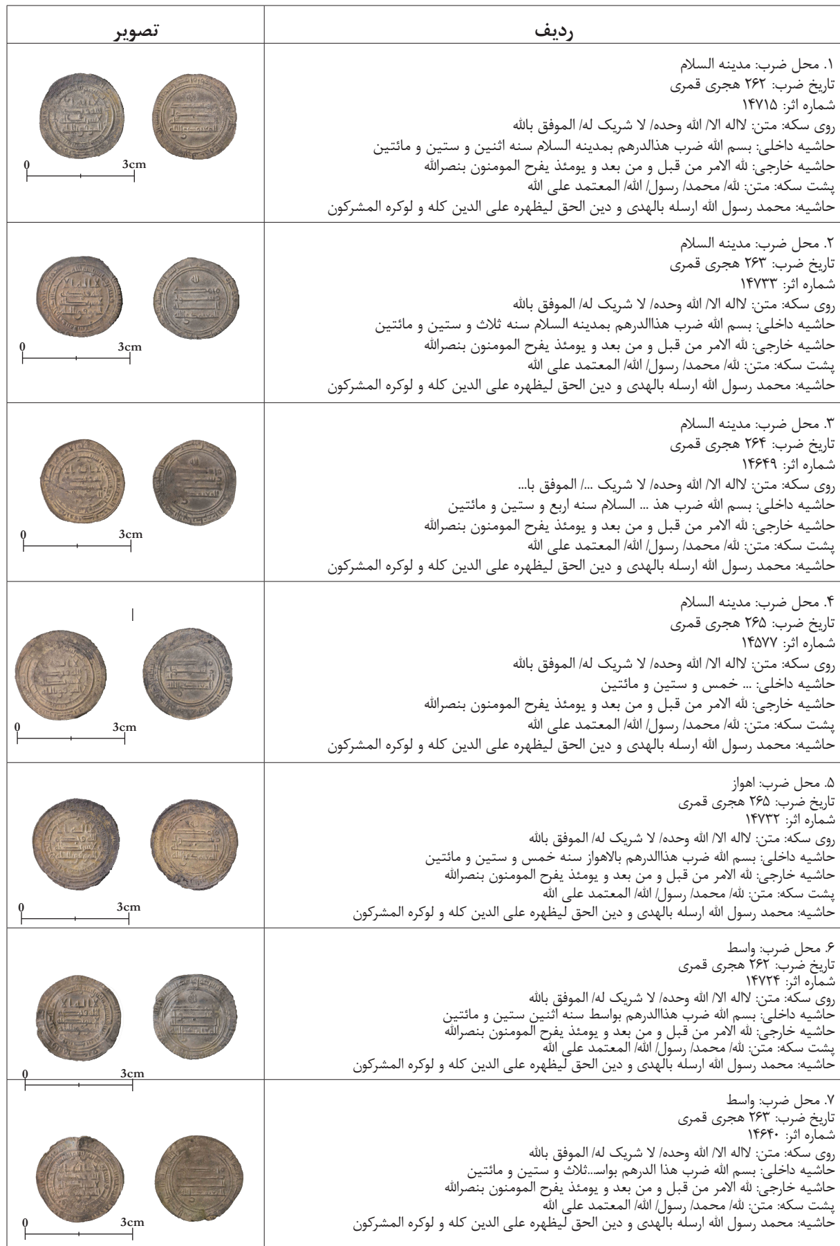
جدول ۳. سکه‌های معتمد همراه با نام موفق.